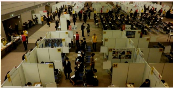
志望動機、熱く語れ 就職面接会

採用された職種で入社後の仕事内容が異なり、その後の配属先もある程度決まる。基本的に以下の3コースだ。①総合職は幹部候補生として育成され海外勤務もある②総合職・リテールコースは個人・法人対象の営業を行う。コンサル業務が主③ビジネスキャリア職は主に窓口業務。金融商品の知識・勉強が必要である。 入社時の資格は特に問わないが、金融業界は新しい金融商品や税制の変更、導入が絶えずあるため、最新の知識や情報が必要だ。専門分野は異なるが顧客に最適なアドバイスが実施できるよう税務・法務・会計等のプロとなることが求められる。 銀行の金融商品は他行とも差別化が難しいため、行員の対応力が勝負。採用選考で意識することは応募者が学生時代に何をし、どのような喜び、達成感を得たのか。留学やボ